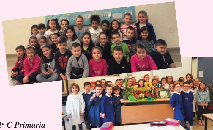
1ª C Primaria

Noi alunni della 1ª C di Scuola Primaria, nel corrente anno scolastico, abbiamo intrapreso un percorso di attività didattiche creative dove i "COLORI" sono stati i protagonisti di due esperienze: In particolare nella prima i "COLORI" hanno fatto da sfondo ad una STORIA DI VALORI per il progetto d'Istituto e nella seconda hanno riguardato l'ORTO SINERGICO. Eccoci in opera: