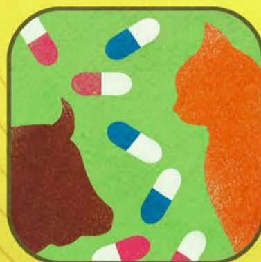
Farmaci per Animali