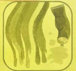
Vernici Inchiostri Adesivi