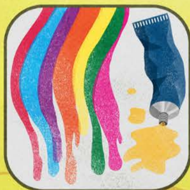
Vernici Inchiostri Adesivi