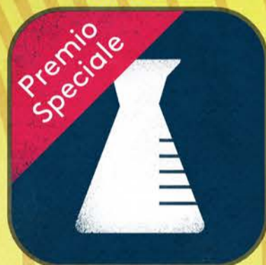
Chimica di base *