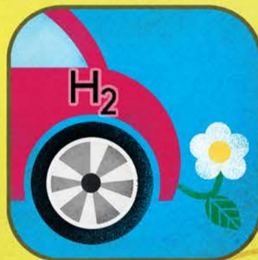
Auto a Idrogeno