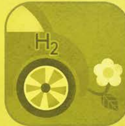
Auto a Idrogeno